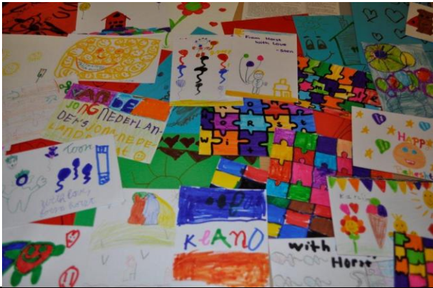
Groetenkaarten gemaakt door groepen kinderen bij J.N./Scouting in Horst.