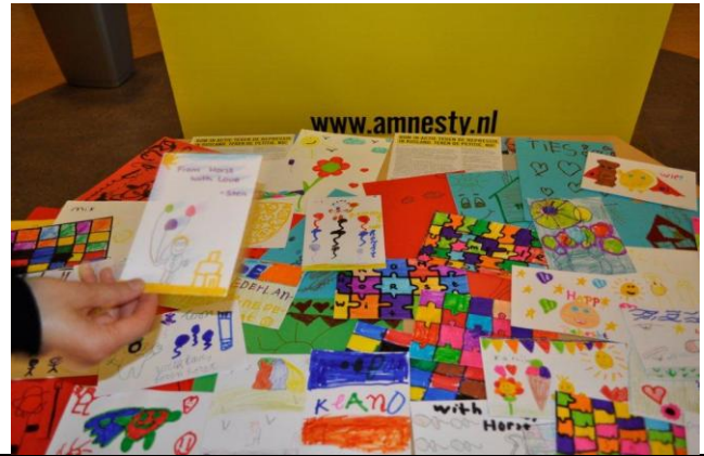
De kaarten worden gestuurd naar kinderen van gevangenen