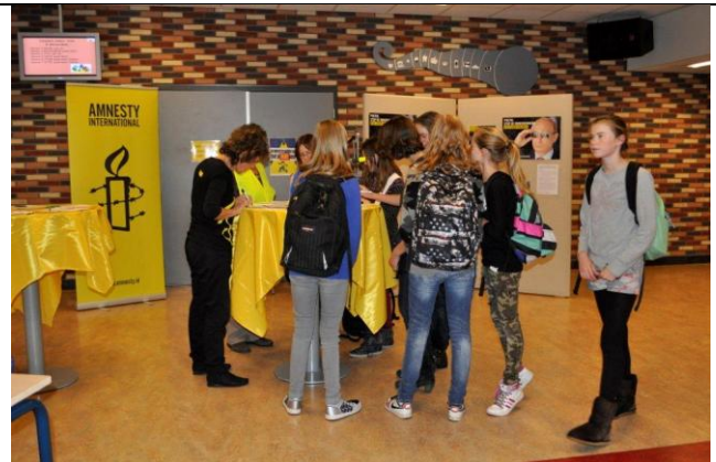
Impressies van de actie op het Dendron College bij de 10 decemberactie.